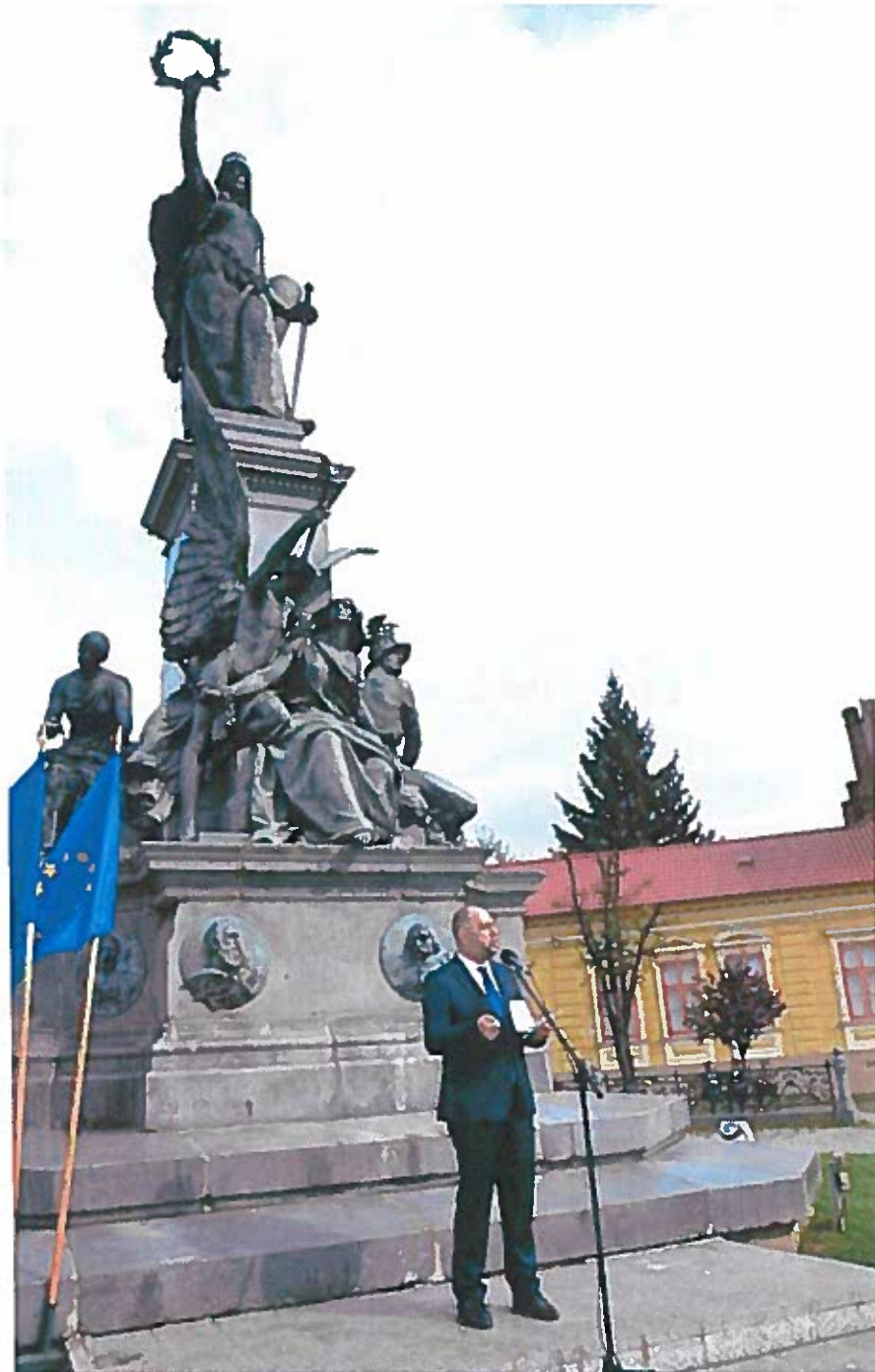
1.) Az aradi Szabadság-szobor újraállításának 10. évfordulós ünnepsége – Arad, 2014. Október 6.