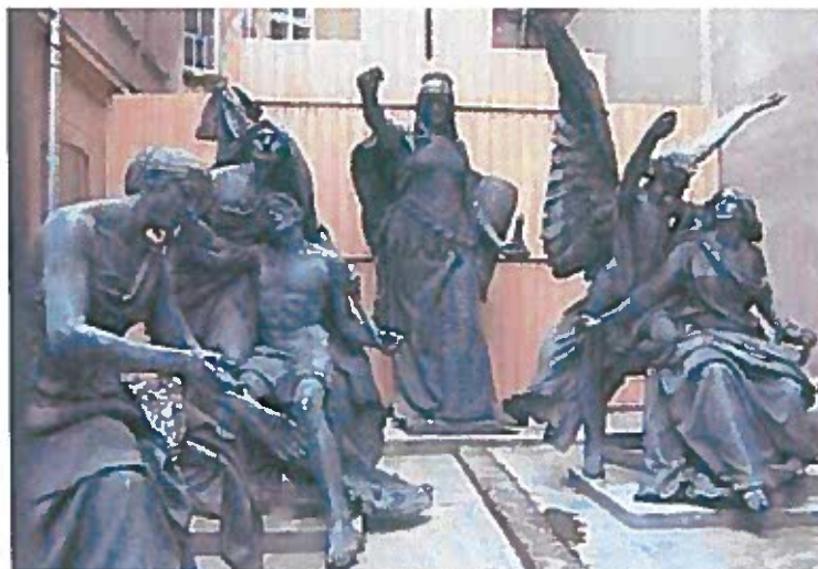
4.) Az aradi Szabadság-szobor 2002. nyarán, a minorita rendház udvarán