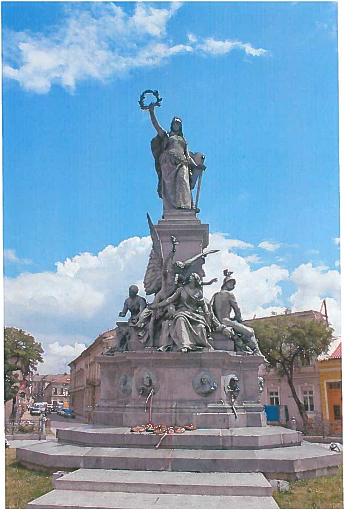
3.) Az aradi Szabadság-szobor napjainkban