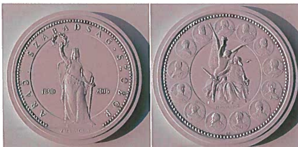
6.,7.) A Szabadság-szobor évfordulójának alkalmából készített emlékérem