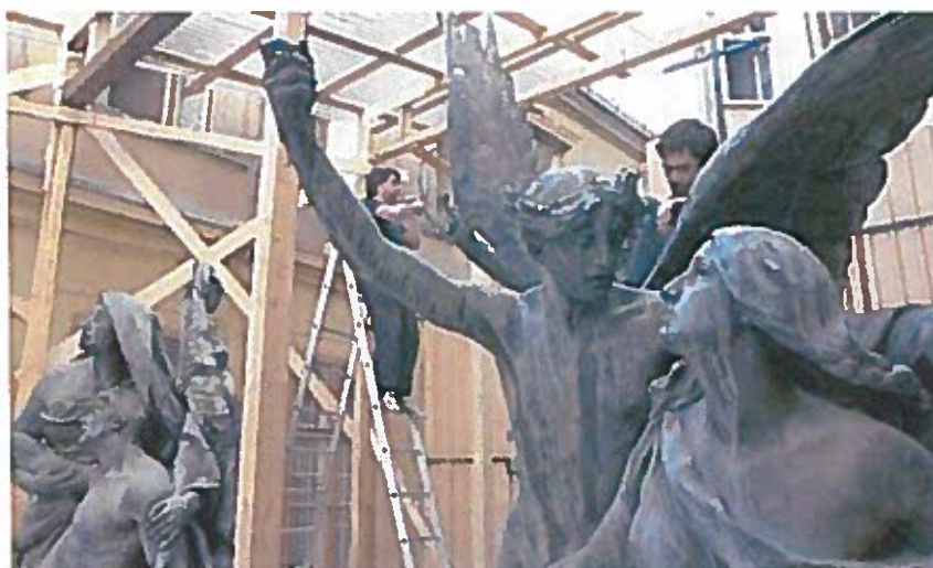
5.) Restaurálás közben