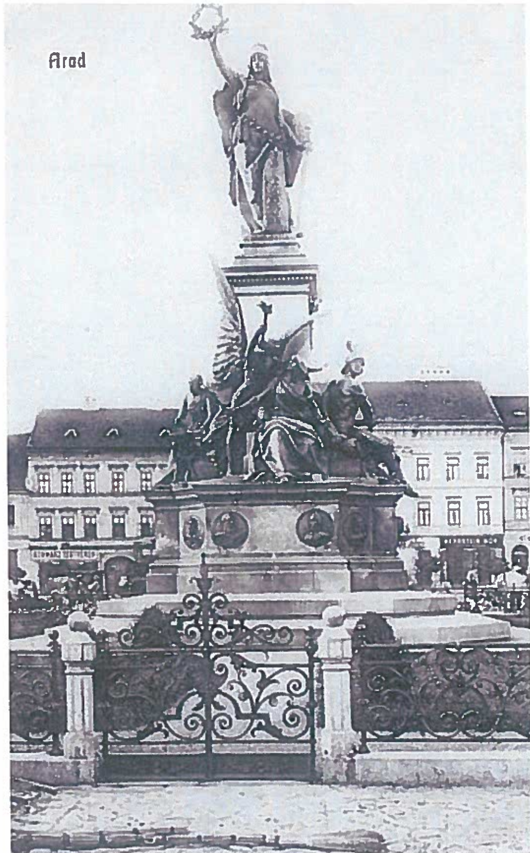
2.) Az aradi Szabadság-szobor az I. világháború előtti időszakban